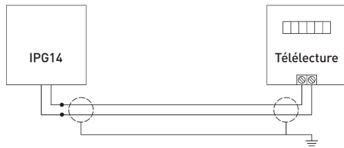
Schéma de commutation